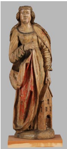
Svätá Barbora z Okoličného