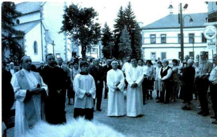
* Inšulii-iit pamätnej tabule