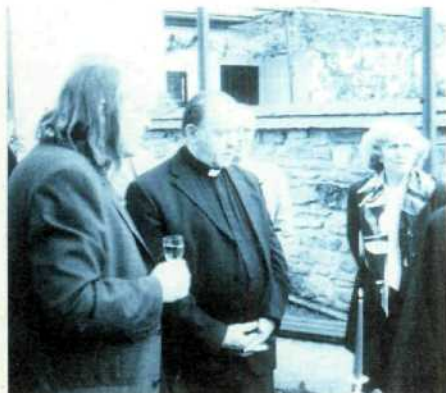
• Čestný predseda v diskusii