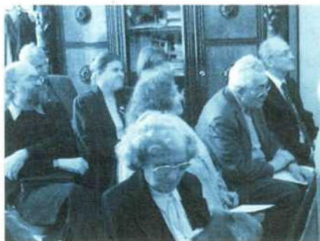
• Pohľad na rokovajúcich členov