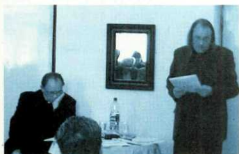
• Prerokovanie stanov spolku