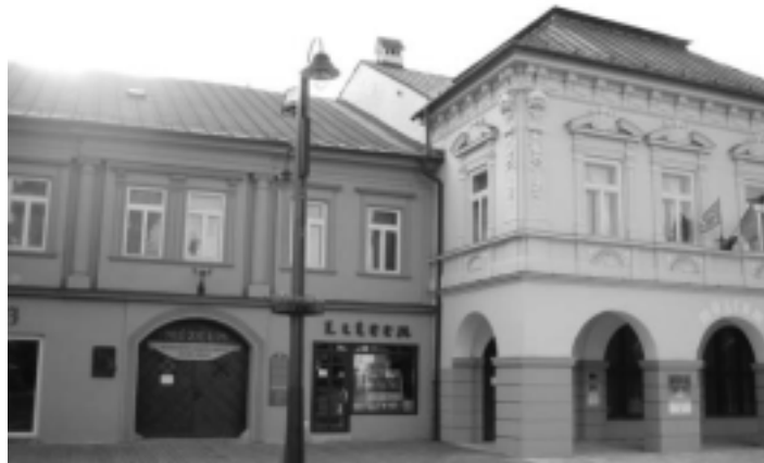
• Tu vyrastal („Seligovie dom“).