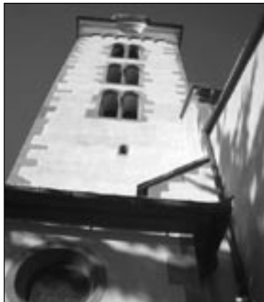
• Majestátna veža kostola sv. Mikuláša