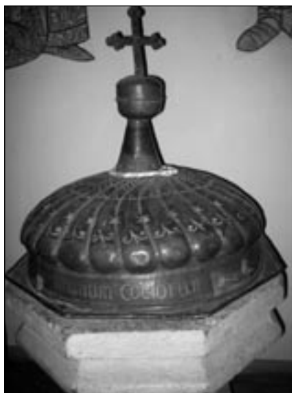
• Krstiteľnica v kostole sv. Mikuláša