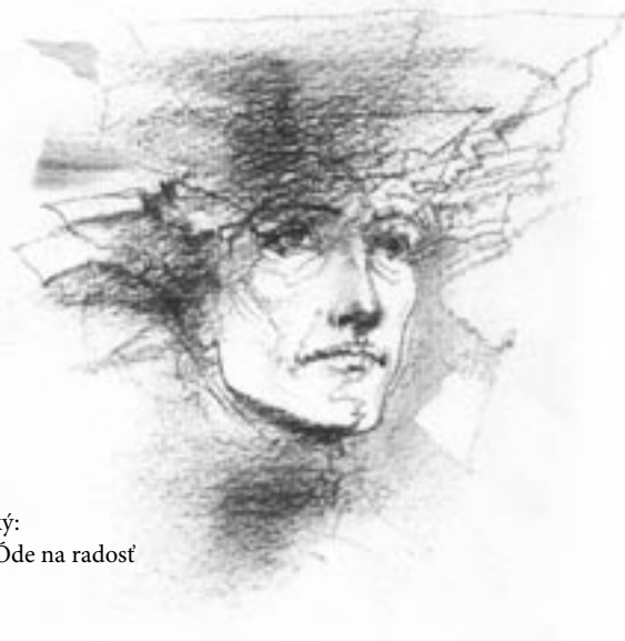
Igor Rumanský: Z ilustrácii k Óde na radosť