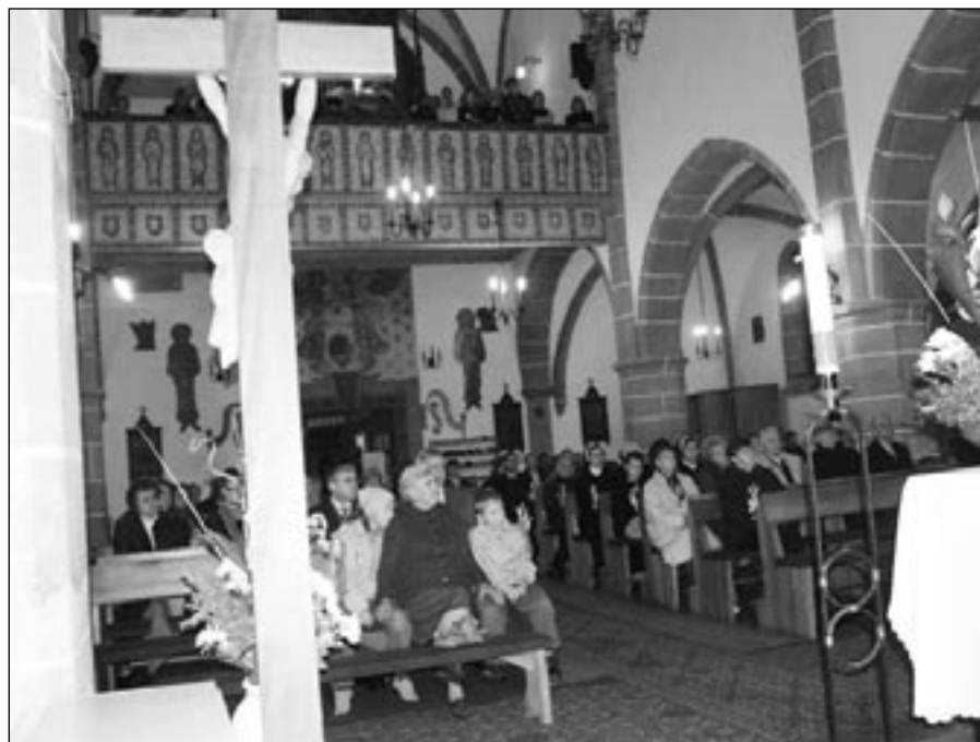
• Sv. omša valného zhromaždenia 2007