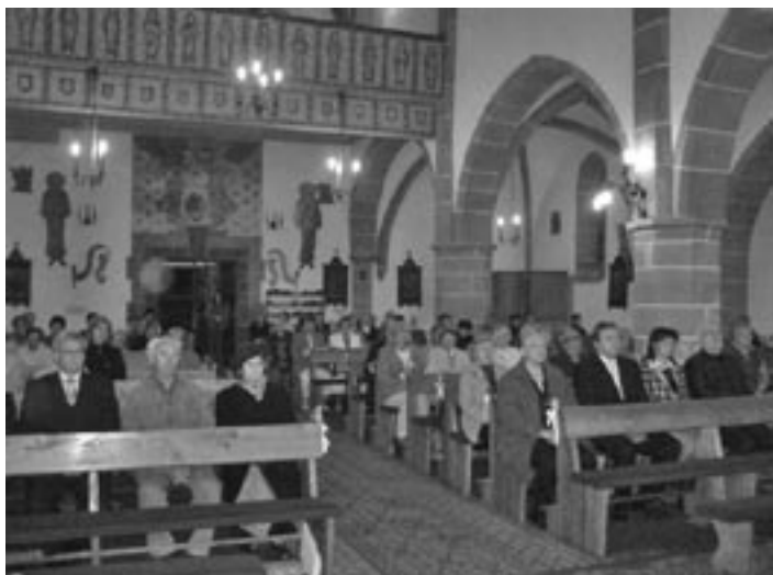
• Svätá omša v kostole Sv. Mikuláša