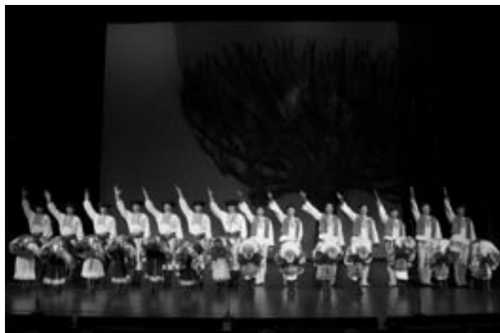
• Súbor Lúčnica