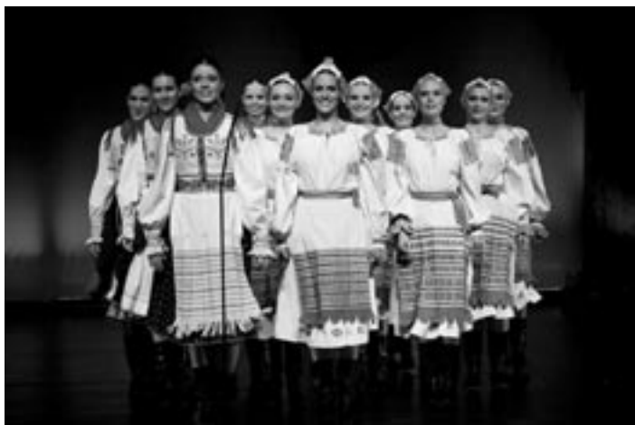
• Tanečnice z Lúčnice