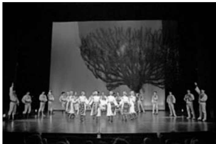
• Vystúpenie Lúčnice

Spolok priateľov MUDr. Pavla Straussa • LISTY PS - Reg. číslo: MK SR 3209/2004, číslo 13, september 2010. Pripravili: Ľubomír Raši, Július Rybák a Jozef Šišila. Adresa redakcie: Múzeum Janka Kráľa, Námestie osloboditeľov 31, tel.: 044/5621 580, e-mail: zuslm@svslm.sk , číslo účtu: 2923832760/1100, IČO: 37907751, tlač: Print Master, Lipt. Mikuláš, e-mail: printmaster@viacom.sk . Počet výtlačkov: 1000.