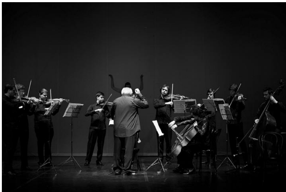
• Slovenský komorný orchester