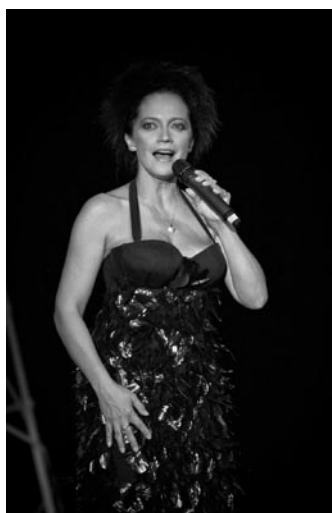
• Speváčka Lucie Bílá